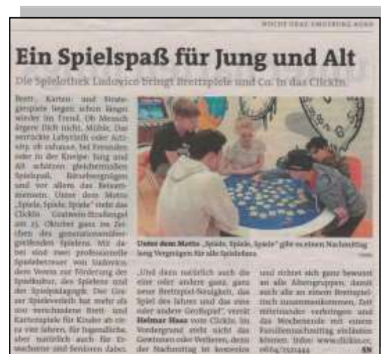
WOCHENBLATT NORD – Oktober 2019