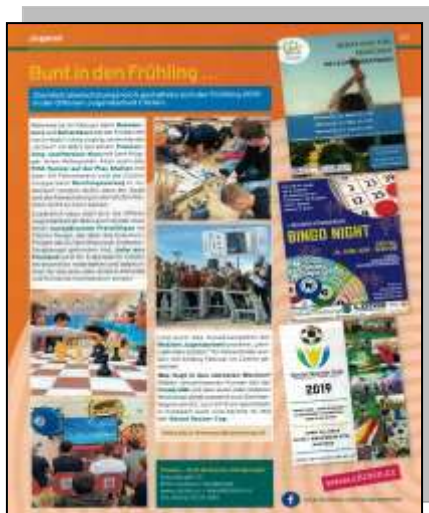
Gemeindeinfo – März 2019