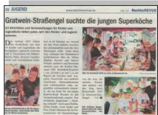
Bezirksrevue – Juli 2019