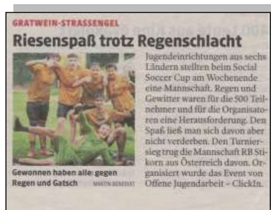
Kleine Zeitung – Juni 2019