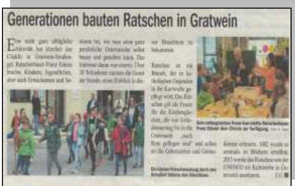
Bezirksrevue – April 2019

Immer wieder unterstützen uns auch die verschiedensten Redaktionen, Zeitungen und Unternehmen in der Medienbranche verlässlich mit Berichten und Ankündigungen bei unserer Arbeit im Jugendzentrum ClickIn. Ein herzliches DANKE für dieses Entgegenkommen!