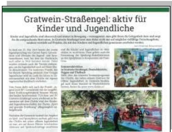
Echt Life Magazin – April 2019